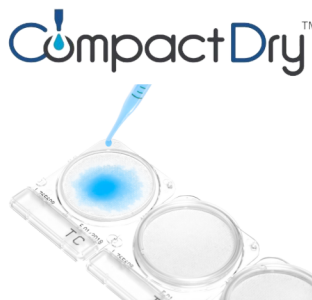
乾式簡易培地 コンパクトドライ™