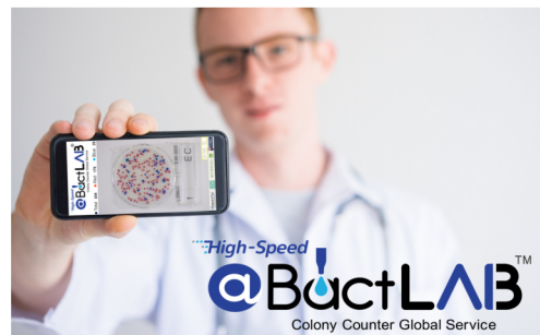
自動コロニーカウントアプリ @BactLAB™