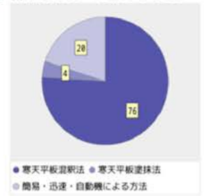
図3. 培養条件による集計